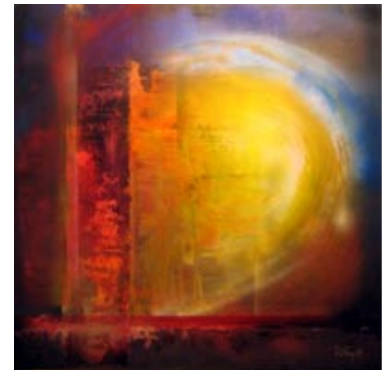
"Power & light"