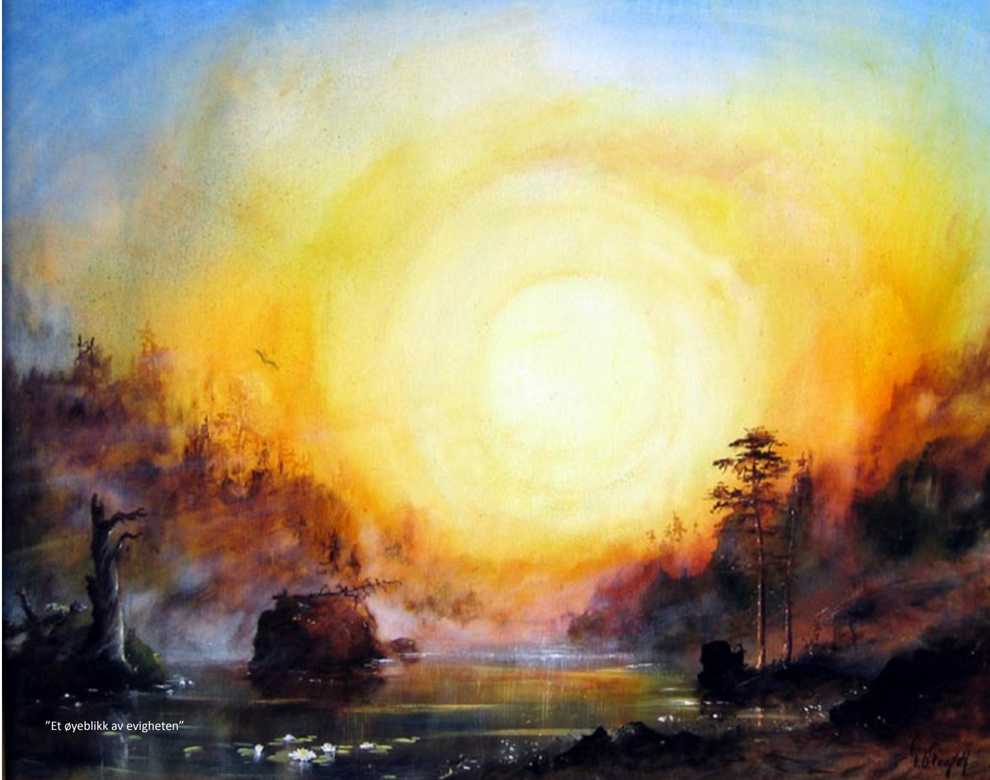
"Et øyeblikk av evigheten"